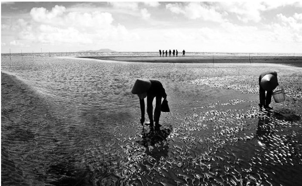
Hình 2. Côn Nghêu, xã Hiệp Thạnh