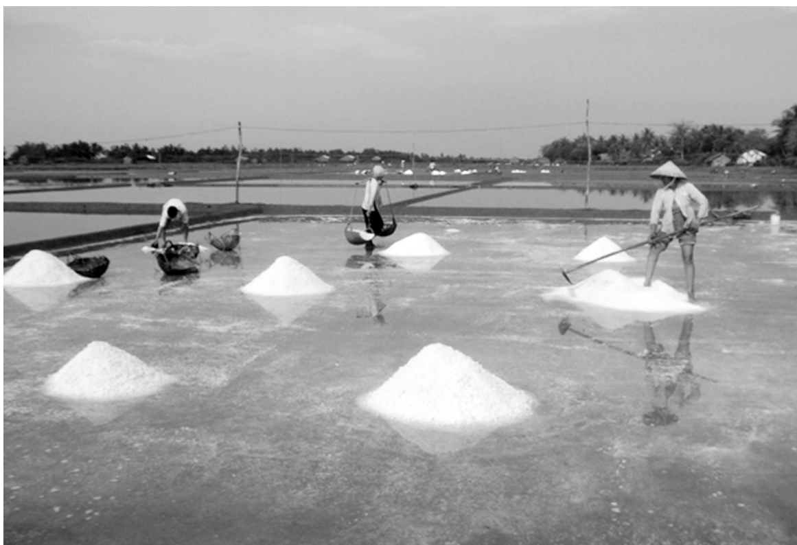
Hình 3. Làng muối Côn Cù, xã Dân Thành